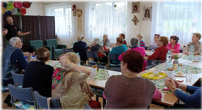
Kurs samoobrony dla seniorów.

Poniżej znajdują się fotografie przedstawiające niektóre wydarzenia z 2023 roku, organizowane przez Towarzystwo Przyjaciół Ziemi Bukowskiej w Bukowsku.