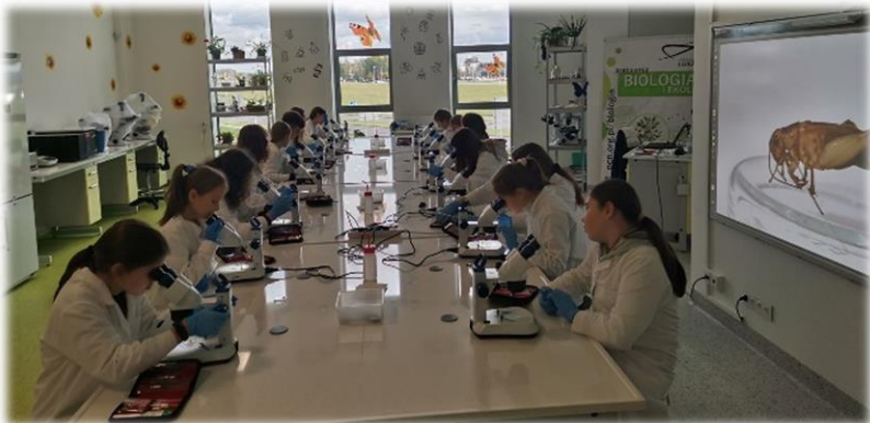
Warsztaty dla młodzieży w Podkarpackim Centrum Nauki „Łukasiewicz”.