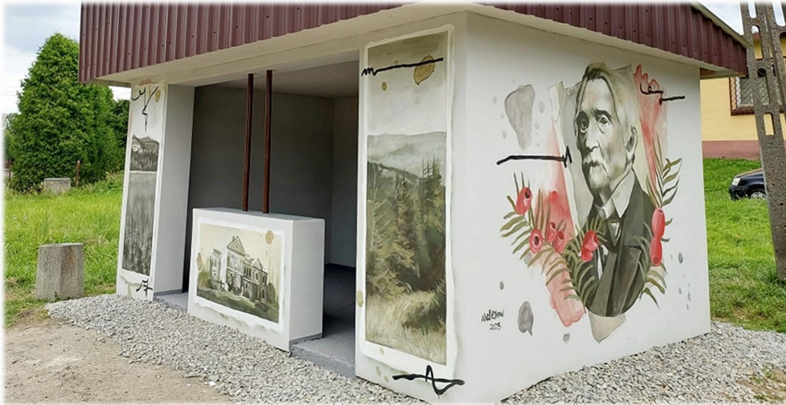
Jeden z murali stworzonych w ramach warsztatów artystycznych oraz aerografu przez mieszkańców Ziemi Bukowskiej, przedstawiający Aleksandra Fredrę